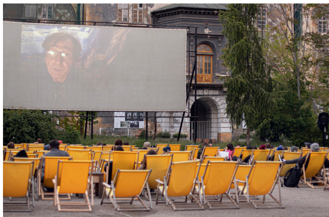
Premiéra projektu Lockwood: Konečný krizový štáb v Kasárnách Karlín

„Každý divadlo si tu krizi musí vyřešit samo...“