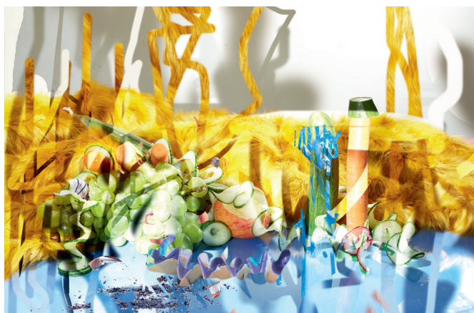
Hlavní cover sezony 2021/2022 s názvem Závislosti

Po sezoně O čem jsme zapomněli mluvit? a Velký úklid vstoupilo A studio Rubín v roce 2021 do 54. sezony s podtitulem Závislosti .