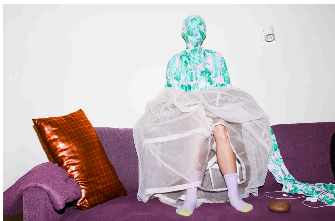
Cover photo inscenace Smrtholka