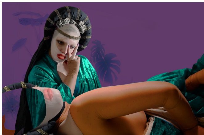
Cover photo inscenace Ruka je osamělý lovec

Na základě osobních výpovědí obyvatel Malé Strany autorky vyobrazily období po roce 1989 do současnosti v kolektivní, společenské rovině. Autorská inscenace se tak snaží upozornit na současné problémy, které se týkají bydlení v centru měst, ale i na předsudky s touto tematikou spojené.