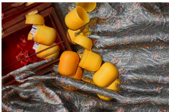
Cover photo inscenace DIY: po tátovi

„Co víme o tom, kdo leží v hrobě, který jdeme upravovat?“ (Jan Balabán, Zeptej se táty)