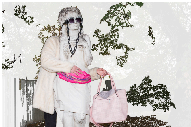
Cover photo inscenace Sweet Home Malá Strana