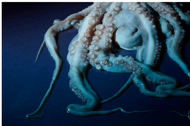
Cover photo inscenace Osobní Fudži