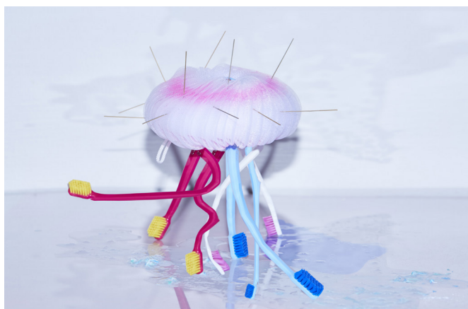
Hlavní cover sezony 2020/2021 s názvem Velký úklid

Po sezoně S kým žijem? a O čem jsme zapomněli mluvit? byla další tematickou sezonou sezona Velkého úklidu . Společenské dění zasáhla v roce 2020 a 2021 výrazná zkušenost s pandemií, která vstoupila do světových dějin jako trhlina, jíž se i my cítíme silně ovlivněni v našich osobních životech. Během této doby každý z nás revidoval, bilancoval a inventarizoval, mnohé hodnoty se převrátily a obnažila se křehkost života.