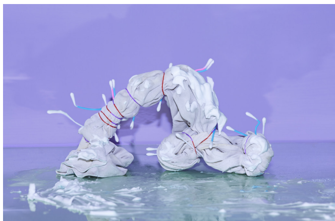
Listopadový cover sezony 2020/2021 s názvem Velký úklid

Do dalšího běhu sezony zasáhla protiepidemiologická opatření, v jejichž důsledku bylo přerušeno zkoušení inscenace režiséra Jiřího Ondry Perníková chaloupka (čekání na lopatu) . Inscenace byla nakonec zkoušena po etapách v rozmezí května až září a k premiéře došlo 6. září 2020.