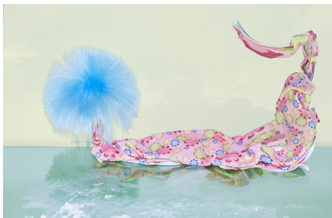
Říjnový cover sezony 2020/2021 s názvem Velký úklid