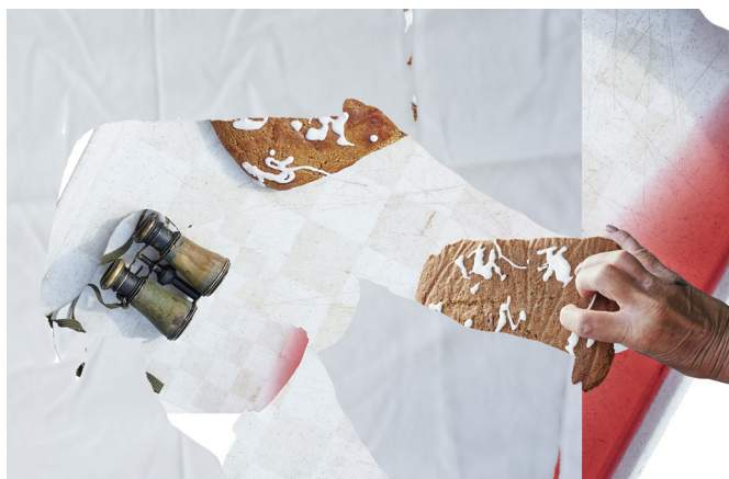
Cover photo inscenace Perníková chaloupka (čekání na lopatu)