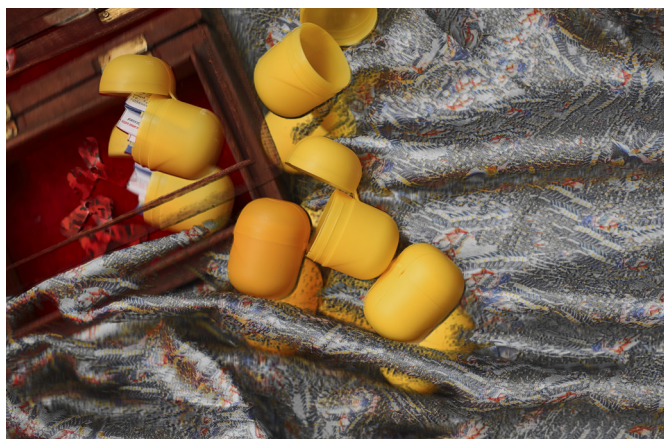
Cover photo inscenace DIY: po tátovi

„Co víme o tom, kdo leží v hrobě, který jdeme upravovat?“ (Jan Balabán, Zeptej se táty )