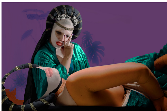
Cover photo inscenace Ruka je osamělý lovec

„Lidé s ženskou identitou jsou největší světovou menšinou.“