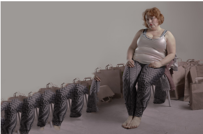
Cover photo inscenace Jenom matky vědí, o čem ten život je